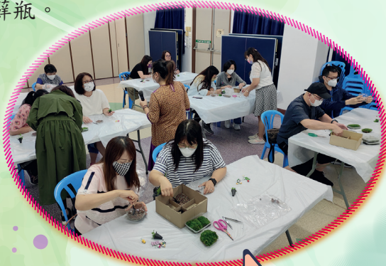
導師及老師協助家長一起製作苔蘚瓶