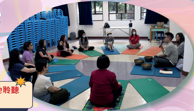
家長們圍坐專心地聆聽導師的講解