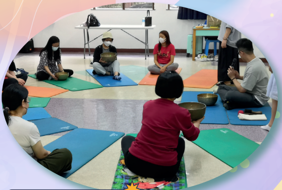
家長們以觸感感受頌鉢的重量及溫度

本年度第二次家長組聚已於3月23日舉行。當天的活動名為「香薰頌鉢體驗工作坊」。活動當天家長們圍坐在軟墊上，細心聆聽導師的講解，導師也用心地指導家長如何透過靜觀安頓身心。家長們透過持鉢、靜坐、感受呼吸等活動，體驗靜觀帶來的靜謐感受。參加者均表示活動導師帶領得很好，在活動中能有所得著。