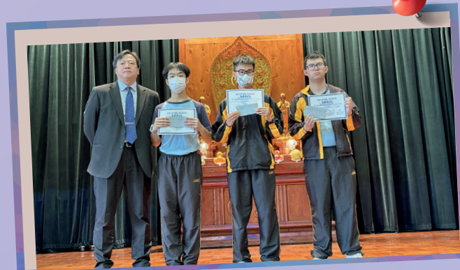
校長與中六級獲獎同學合照。