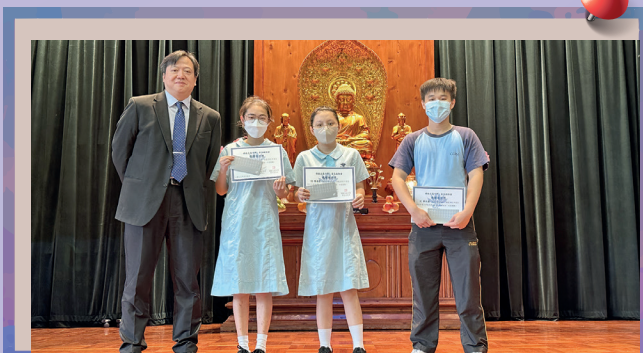
校長與中五級獲獎同學合照。