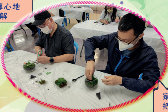
家長們專注投入地把物料放進瓶子裏