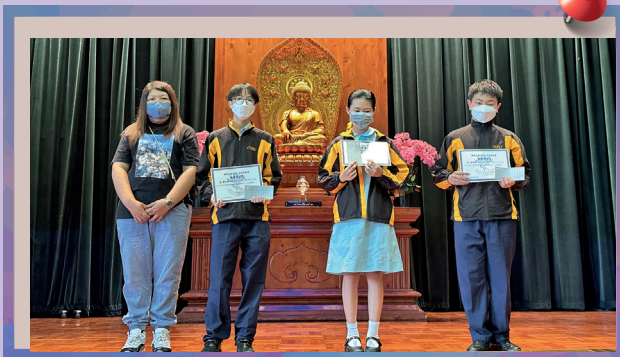
家長教師會主席與中一級獲獎同學合照。