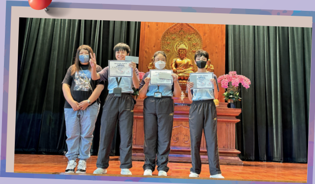
家長教師會主席與中三級獲獎同學合照。