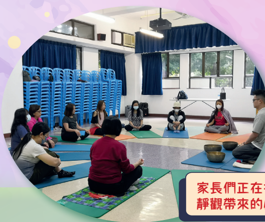
家長們正在打坐，感受靜觀帶來的感覺