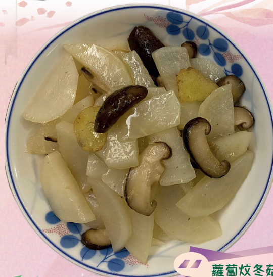
蘿蔔炆冬菇 (4C 李丞滸作品)