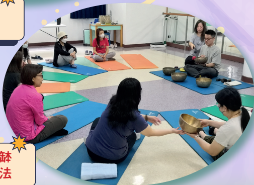
導師示範敲響頌鉢需用力度及方法

本年度第二次家長組聚已於3月23日舉行。當天的活動名為「香薰頌鉢體驗工作坊」。活動當天家長們圍坐在軟墊上，細心聆聽導師的講解，導師也用心地指導家長如何透過靜觀安頓身心。家長們透過持鉢、靜坐、感受呼吸等活動，體驗靜觀帶來的靜謐感受。參加者均表示活動導師帶領得很好，在活動中能有所得著。