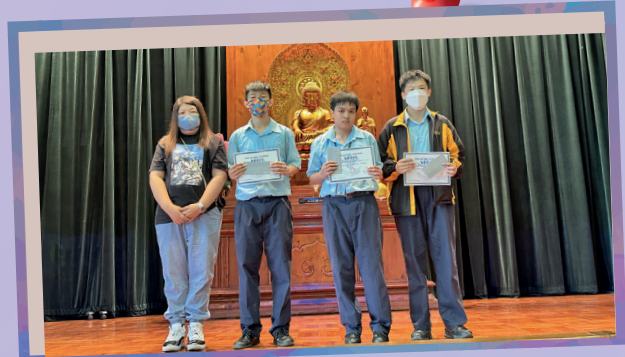
家長教師會主席與中二級獲獎同學合照。