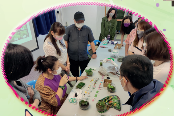
家長們圍桌專心地聆聽導師的講解

5月11日迎來了本年度第三次家長組聚，舉辦了「苔蘚瓶製作工作坊」。當天家長們運用苔蘚、厥類植物和小飾物親手配搭和製作一個苔蘚瓶。過程中，大家都專注聆聽導師的講解，也很用心地把材料錯落有致地安放在瓶中。最後，大家都很有滿意自己的製成品——漂亮別緻的苔蘚瓶。