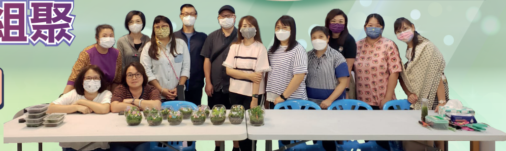
終於製成漂亮別緻的苔蘚瓶，大家一同合照留念

5月11日迎來了本年度第三次家長組聚，舉辦了「苔蘚瓶製作工作坊」。當天家長們運用苔蘚、厥類植物和小飾物親手配搭和製作一個苔蘚瓶。過程中，大家都專注聆聽導師的講解，也很用心地把材料錯落有致地安放在瓶中。最後，大家都很有滿意自己的製成品——漂亮別緻的苔蘚瓶。