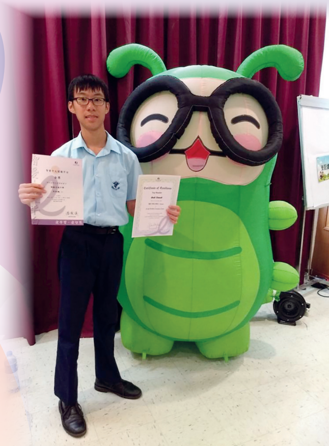
祐翹在學期間，獲取不少獎項，付出獲得肯定。

我們深信在家庭與學校配合得宜的情況下，終能為我們的孩子奠定良好的基礎，創造美好的明天。