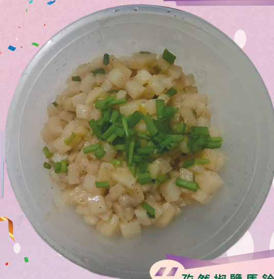
孜然椒鹽馬鈴薯 (6A 楊樂怡作品)