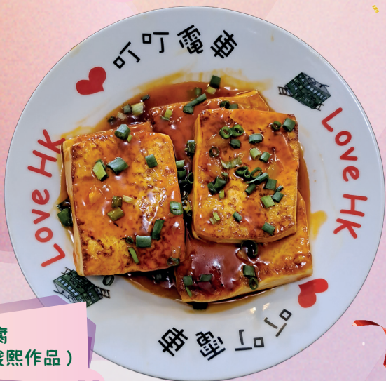
糖醋豆腐 (5A 林俊熙作品)