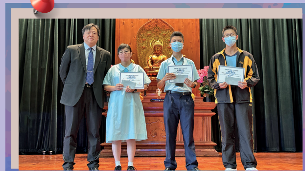
校長與中四級獲獎同學合照。